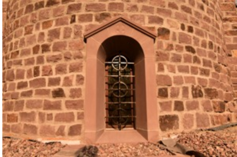
Das Altarfenster der Krypta aus Werkstücken. Im Gitter drei Sonnenkreuze als Hinweis auf die Heilige Dreifaltigkeit !