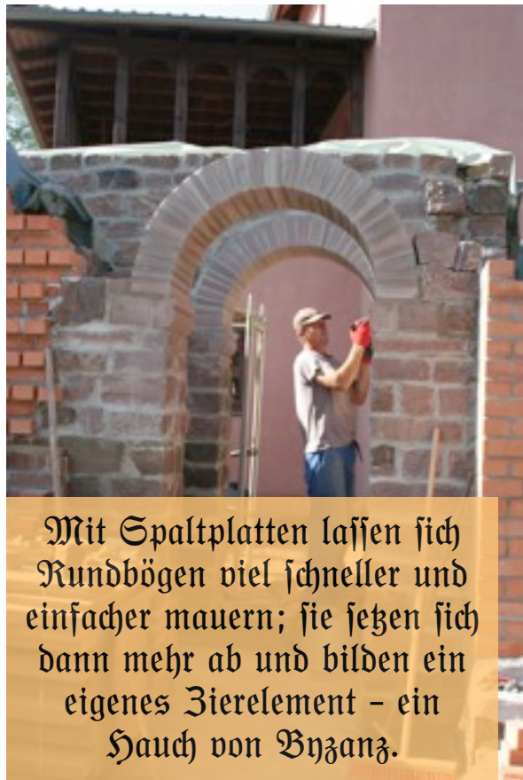
Mit Spaltplatten lassen sich Rundbögen viel schneller und einfacher mauern; sie setzen sich dann mehr ab und bilden ein eigenes Zierelement – ein Hauch von Byzanz.