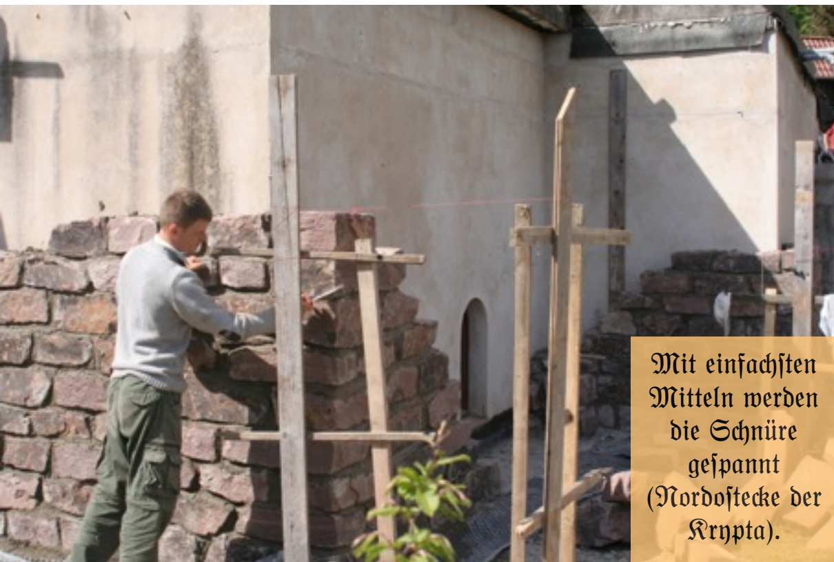
Mit einfachsten Mitteln werden die Schnüre gespannt (Nordostecke der Krypta).