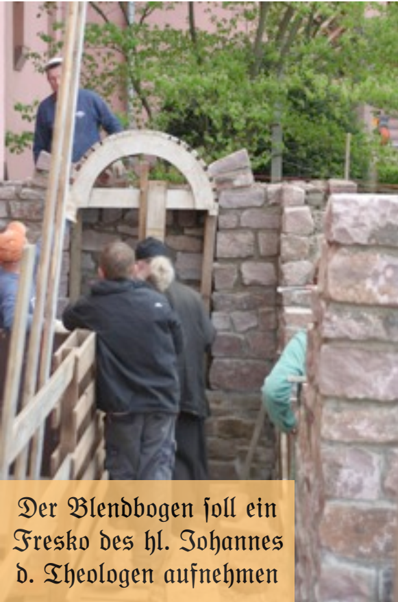
Der Blendbogen soll ein Fresko des hl. Johannes d. Theologen aufnehmen