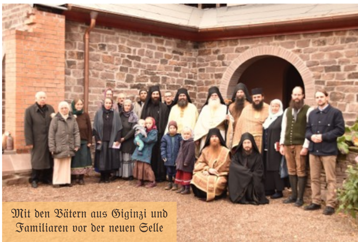
Mit den Vätern aus Giginzi und Familien vor der neuen Selle