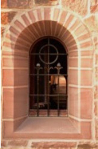
Kryptafenster auf der Nordseite; im Fenstergitter ein Sonnenkreuz und zwei Blütenstäbe